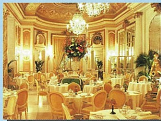
●名門リッツホテルで優雅なアフタヌーンティーを!