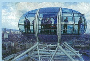
●英国が誇る「ロンドン・アイ」 ウェストミンスター寺院やビッグベンが上から見ると最高!