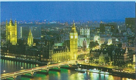
●魅力あふれるロンドン!